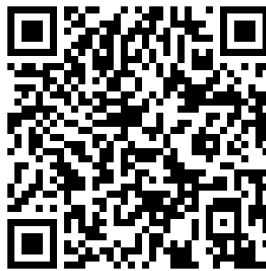
APLICACIÓN SMARTPHONE ANDROID